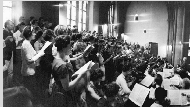
Chorkonzert der Staatlichen Hochschule für Musik unter Hindemiths Leitung in der Dreikönigskirche, 1963